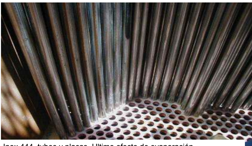
Inox 444, tubos y placas. Ultimo efecto de evaporación. Ingenio Alta Mogiana, Brasil – 2004

Considerando la buena resistencia a la corrosión en presencia de cloruros, el 444 substituye en algunas aplicaciones industriales a los aceros 316/316L, ya que al no contener níquel (Ni), el 444 tiene un precio más competitivo. En ciertos casos, cuando puede ocurrir corrosión bajo tensiones, el 444, inmune a esta forma de corrosión, substituye en ciertas aplicaciones industriales a los aceros 316/316L y también 304/304L. En la industria azucarera , por ejemplo, existe utilización de 444 en tubos de evaporadores y también en la construcción del cuerpo de los evaporadores.