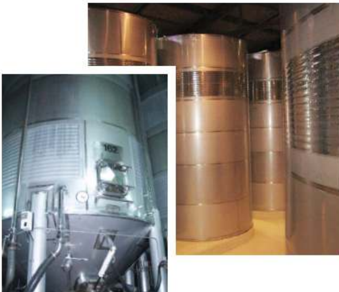
Tanques para vino. Acero 316L.

El inoxidable 444 también es adecuado en estas aplicaciones.