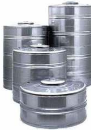
Tanque de agua. Acero 444.

En tanques para vinos, 304/304L son muy utilizados. Es común que se usen 316/316L en la parte superior de los tanques o a veces en todo el tanque (principalmente en el caso del vino blanco que tiene un proceso de fabricación más agresivo que el tinto).