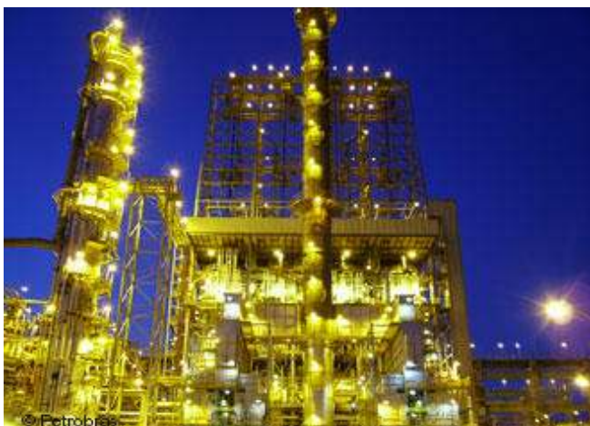
Industria química. Acero 316L

En industrias con procesos bastante corrosivos, los inoxidables 316/316L son muy utilizados ( papel y celulosa, química, petroquímica ). En chapas gruesas, en general, los aceros inoxidables 316/316L son más preferidos que el 444.