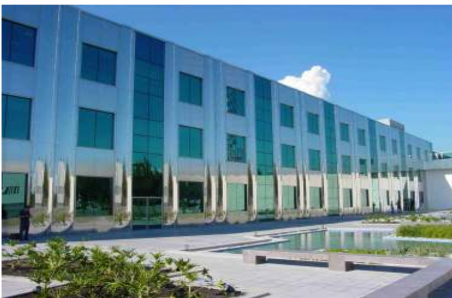
Edificio de VIVO, Rio de Janeiro 2.006. Arquitecto Edo Rocha. Aceros 444 y 316

Un edificio en la ciudad de Rio de Janeiro, Brasil, próximo al mar , combina paneles brillantes de acabado buffing bright de 316 con paneles con esmerilado N°4 de 444.